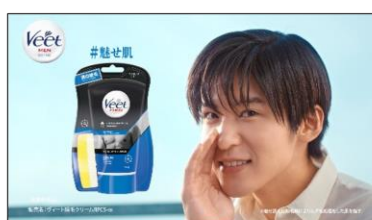
魅せ肌でいこう！ヴィートメン