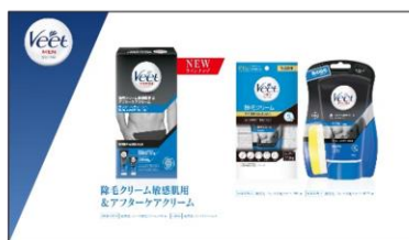
新ラインナップも！