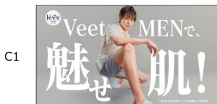
ヴィートメンで、魅せ肌！