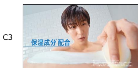
いつものシャワータイムに